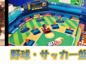
野球・サッカー盤

※野球盤・サッカー盤は1フロビーでご利用いただけます。お部屋への貸し出しはございません。